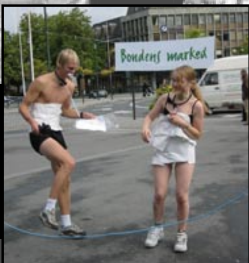
2) Bamse, bamse, ta i bakken, bamse, bamse, vend deg om. Kom igjen nå. Slik jentetripping er for pingler, det er høye kneløft som er tingen for å få gode lårmuskler.