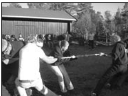
Tautrekking: Komtek måler krefter med data, og med erfarne kretslestre på laget vant de selvfølgelig.

Neste morgen så stua ut som en slagmark; det lå noen få overlevende rundt omkring, og det var flust med tomgods