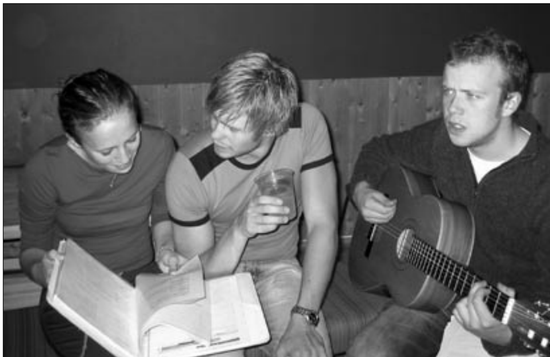
Stemning: Gitarspilling, øl og sangbok sørger for god stemning i sofaen

Badevannet fikk etter hvert en noe uggen farge som heller ikke innbød til bading for oss fornuftige. Arrkom hadde ordnet med noen selskapsleker for kvelden, til stor glede for oss førsteklasinger, selv