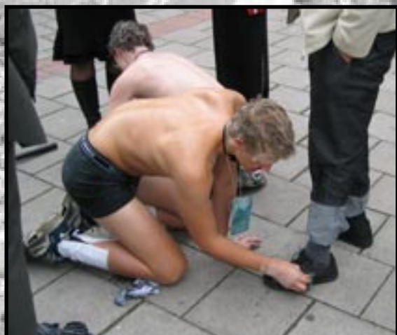
5) Puss, puss. Listingløperne pussar i vei på både sko og vei. Ingen fotgjengerfelt er så reine som de utenfor Egon.