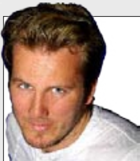
Ville du tatt imot en rose fra denne mannen?

Hva er foretrekker du, blonde eller mørke menn?