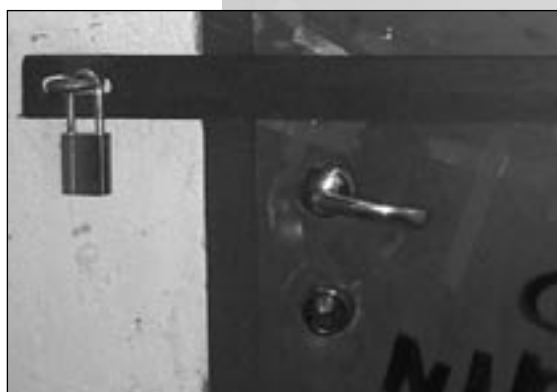
Stengt: Dette blir et vanlig syn framover