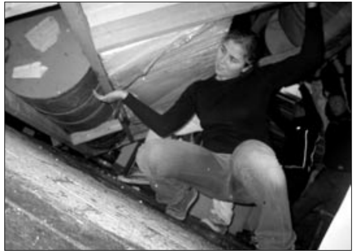
Girlpower: Super-Marit viser hvem som er det sterke kjønn.

og mye øl begynner flåta til komtek å ta form, til tross for folk som prøver å flytte hele greia ved å dra i den dårligst festede delen. Det er tønner og planker på alle bauger og