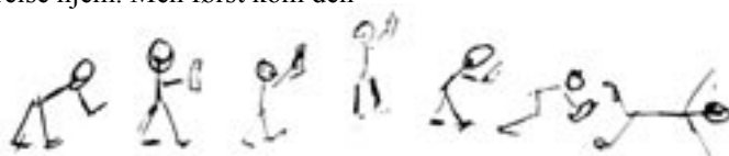
A(t): Alkohol som funksjon av tid.