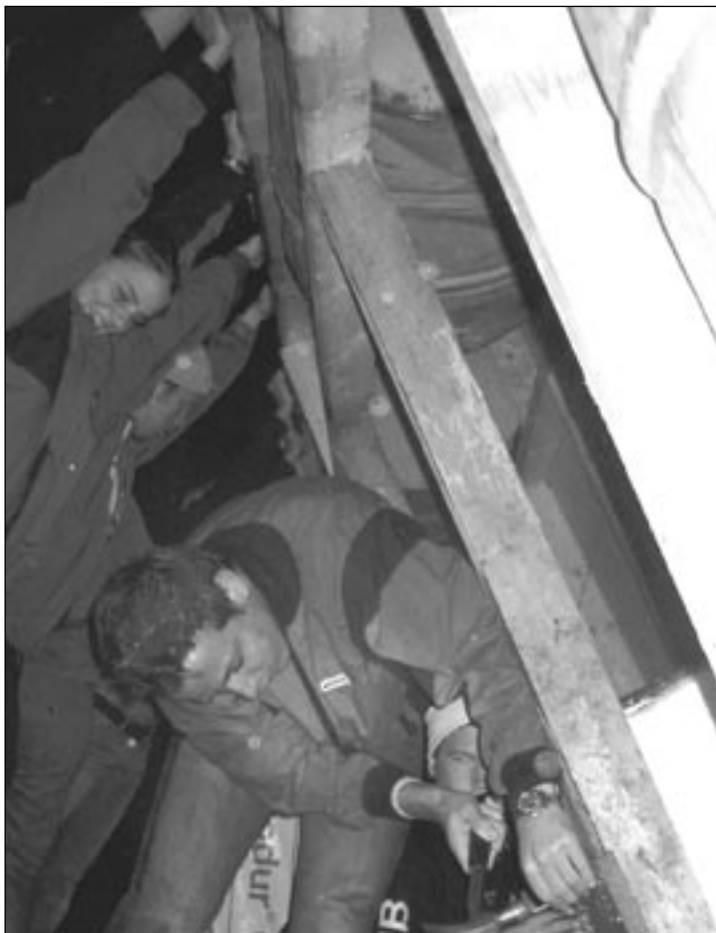
Hardt: Tøff jobbing dag ut og dag inn i fire uker kan ta på noen og enhver.