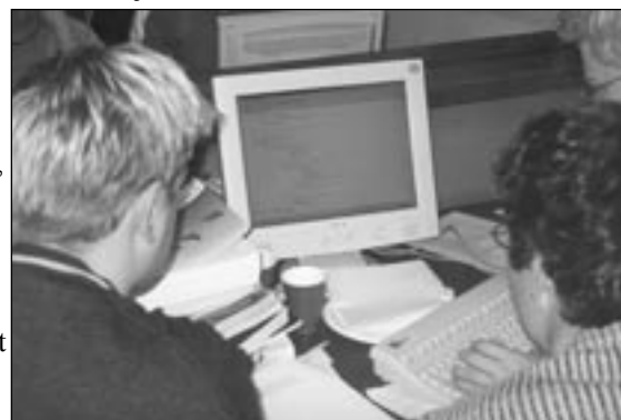
Konsentrerte NM-i-prog-deltakere.

å hevde seg mot våre gode naboer. Det hører med til historien at det var stor tvil om en av /dev/duff sine oppgaver, og at dommerpanelet brukte lang tid på å komme fram til at den skulle underkjennes. Hadde denne oppgaven blitt godkjent ville /dev/duff hatt en god sjanse til å gå av med seieren.