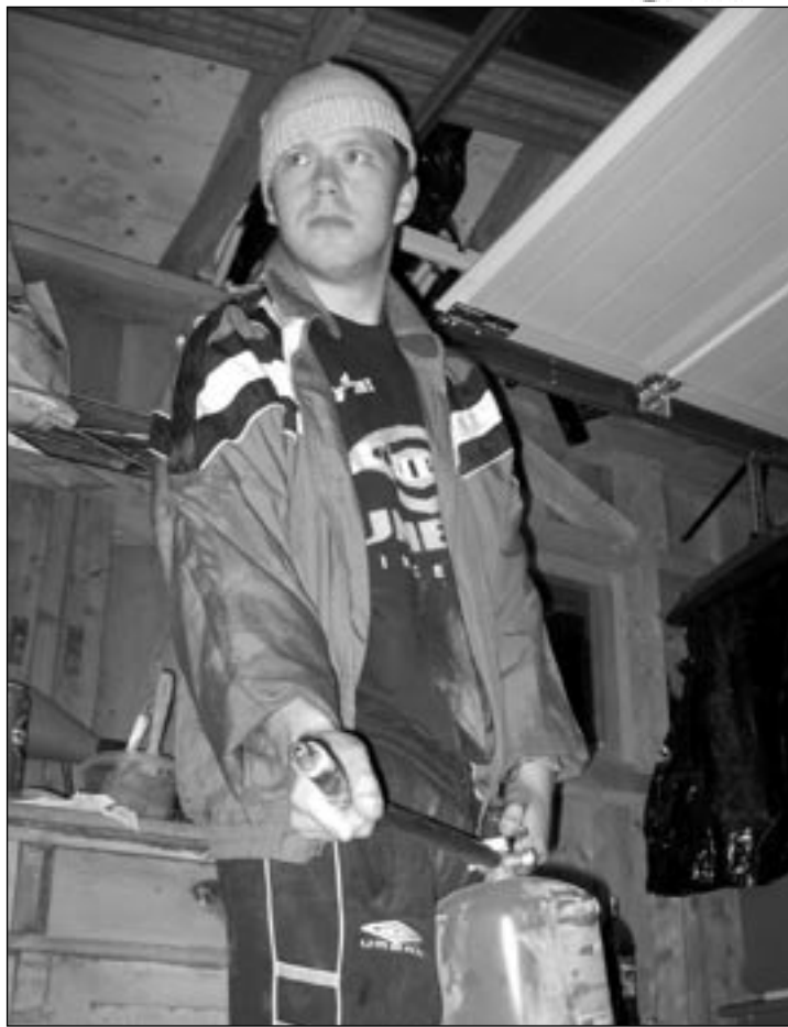
Terror: Med pulver og vannkanon skal brannmennene gjøre det hett for motstanderne