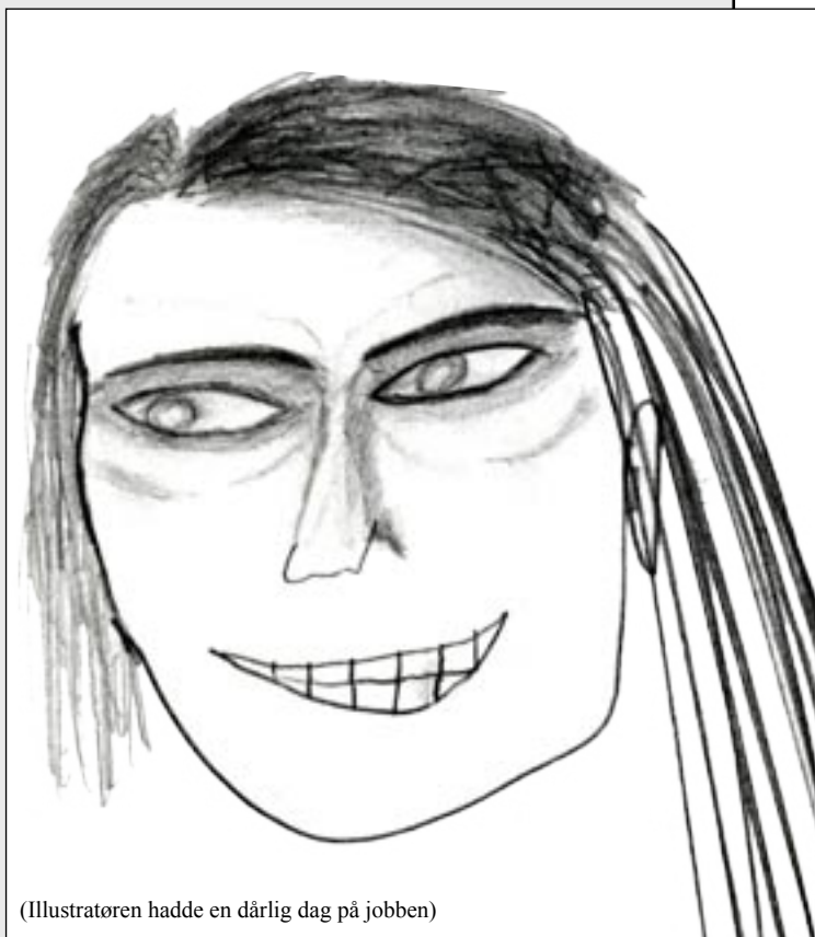
(Illustratøren hadde en dårlig dag på jobben)