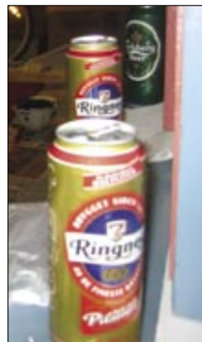
Øl og maling: Kreativiteten og kunstnernevne stiger gjerne proporsjonalt med promillen.

- Fredag natt blir det sovepose og liggeunderlag i garasjen. Det blir å drekka og jobbe, avslutter ingeniøren og terrorsjefen før de går tilbake til konstrueringen.