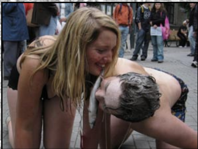
7) Voff, sier hunden, og spiser fisk. Kampen for tilværelsen er et skikkelig bikkjeslagsmål. Helsebringende olivenoljemassasjer fant også sted på denne posten.