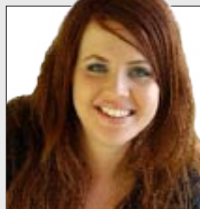
Er dette et godt kjerringemne?