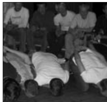
Leking: Hva gjør egentlig disse?

at vi hadde med betydelig mindre bagasje tilbake; etter opprydningen kunne vi nemlig konstatere at resultatet av to dagers hyttetur var fire søppelsekker med tombokser og et stort antall esker med glassflasker.