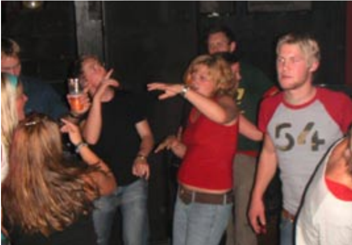
Nå må vel snart lydanlegget i bodegaen bli fikset?

førstiser måtte nok vende slukøret hjem eller ut i Trondheims mandagsuteliv, Samfundet ble nemlig svært så fullt denne kvelden! Annet