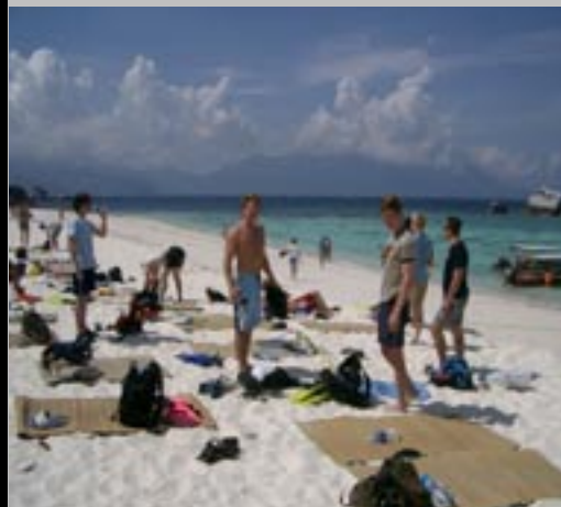
Snorkletur til Coral Island utenfor Tioman