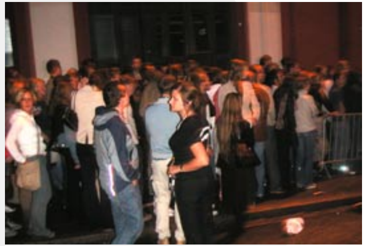
Heldigvis slapp samfundetmedlemmer forbi køen.

opp Moholts eneste partytelt utenfor, applaus! Dette var for mange et kjærkomment tiltak, da barteværet ikke uteble. Ettersom temperaturen steg til uante høyder og promillen