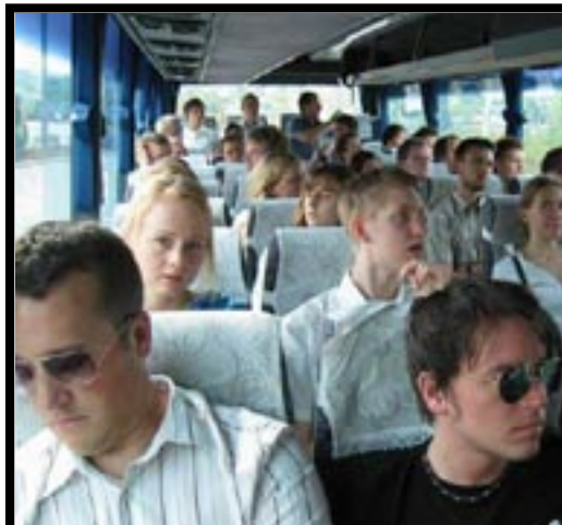
Klassen på vei til bedpress