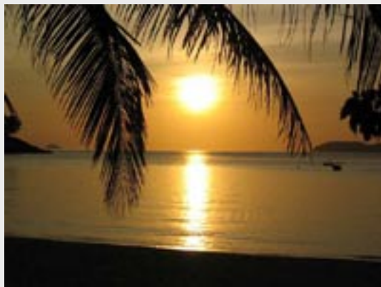
Solnedgang på Tioman

Samme dag dro klassen (uten professorer) videre til Tioman, en sydhavsøy på østkysten av Malaysia. Der bodde vi