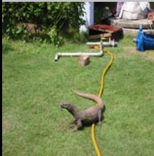
En halvannen meter lang varan som bodde der vi bodde...